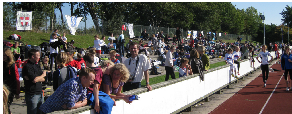
Billedet er fra Afslutningsstævnet i 2008.

Vi har afholdt stævnet med stor succes og megen ros igennem flere år og har i ca 20år været et af Danmarks største åbne ungdomsstævner, med udenlandsk deltagelse fra Sverige, Norge, Tyskland og Italien. Nogle år har der været mere end 700 deltagere, 50 klubber og over 2.500 starter. Der er normalt op til 9 øvelsessteder (løb, 3 x længdespring, 2 x højde, bold, diskos og spyd) i gang samtidig det meste af lørdagen. Med over 250 deltagere afvikles 200meterne på godt 3 timer, og længdespring, som klart er favorit disciplinen, tager ca 17 timer at afvikle for alle grupper.