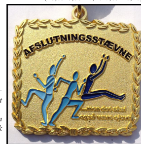
Den flotte Afslutningsstævne medalje er designet af Filippa Abild i 2009. I 2015 har vi lavet medaljen lidt tykkere og i mere rustik materiale.