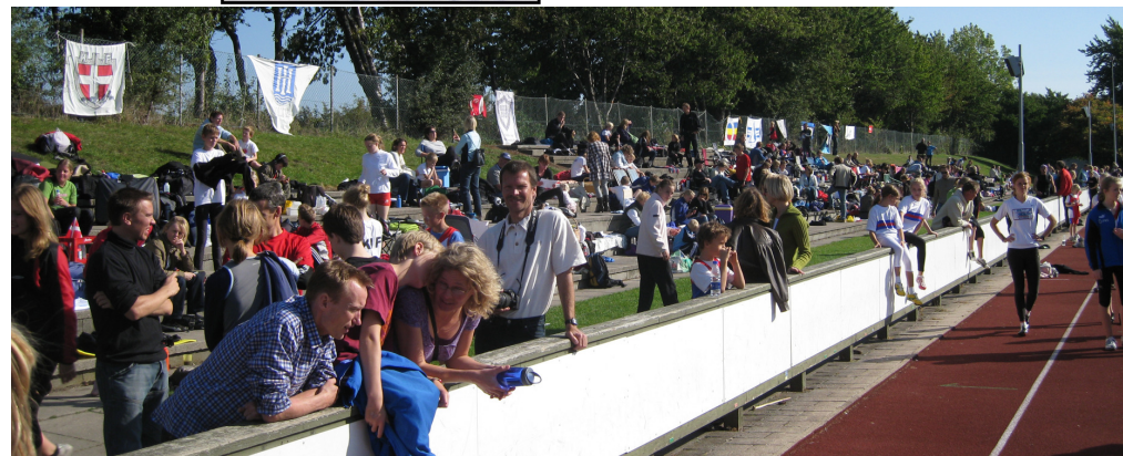
Billedet er fra Afslutningsstævnet 2008 d. 27. og 28. september.

Vi har afholdt stævnet med stor succes og megen ros igennem flere år og har i ca 9år har det været et af Danmarks største åbne ungdomsstævner, med udenlandsk deltagelse fra Sverige, Norge, Tyskland og Italien. I 2016 var der 678 tilmeldte deltagere fra 41 klubber og efter stævnet havde der været 2.101 starter. For at afvikle øvelserne mest effektivt, er der løb på begge langsider og 9 øvelsessteder (2 x løb, 3 x længdespring, højde, bold, diskos og spyd) er i gang samtidig det meste af lørdagen. Med over 250 deltagere afvikles 200meterne på godt 3 timer, og længdespring, som klart er favorit disciplinen, tog ca 17 timer at afvikle med 325 deltagere.