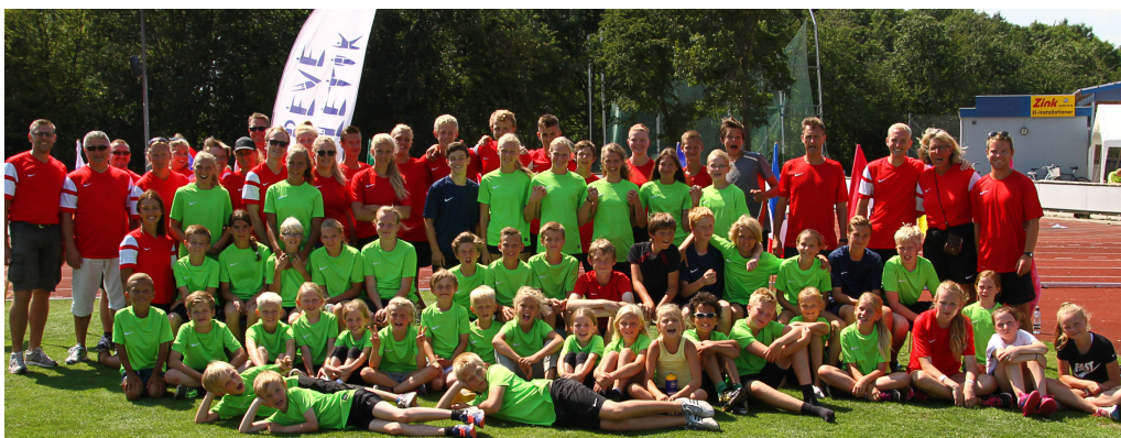
Atletikskolen er en uge i skolernes sommerferie, hvor unge 8-16årige får mulighed for at prøve atletik og møde en masse nye venner. Aktiviteterne er hver dag fra kl 9-15, både på stadion, på stranden og i hallen.

Billedet er fra vores Atletikskole i 2014, pga forventet stadion ombygning kunne vi desværre ikke invitere til atletikskolen i 2015 og 2016.