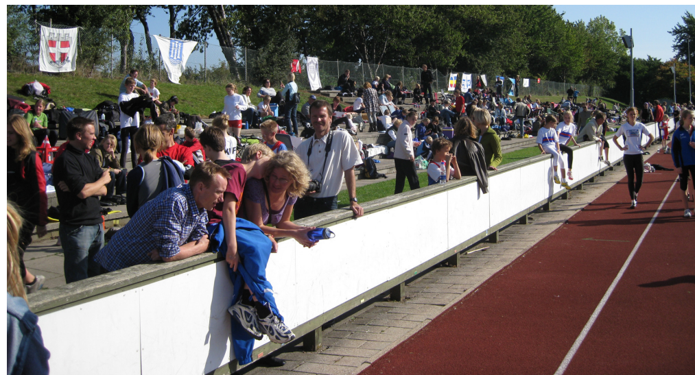
Billedet er fra Afslutningsstævnet 2008 d. 27. og 28. september.

Vi har afholdt stævnet med stor succes og megen ros igennem flere år og de seneste 8 år har det været et af Danmarks største - sandsynligvis det største åbne ungdomstævne, med udenlandsk deltagelse fra Sverige, Norge, Tyskland og Italien. I 2013 var der 642 tilmeldte deltagere fra 39 klubber og efter stævnet havde der været 2.158 starter. For at afvikle øvelserne mest effektivt, er der løb på begge langsider og 9 øvelsessteder (2 x løb, 3 x længdespring, højde, bold, diskos og spyd) er i gang samtidig det meste af lørdagen. Med 200 deltagere afvikles 200meterne på godt 3 timer og længdespring, som klart er favorit disciplinen, tog ca 18 timer at afvikle med 359 deltagere.