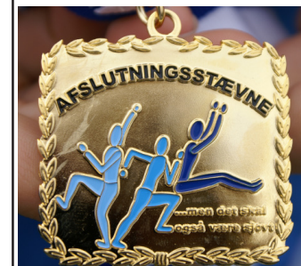
Den flotte Afslutningsstævne-medalje som Filippa Abild har designet i 2009 - får stadig megen ros blandt medaljetagerene, forældre og trænere/ledere.