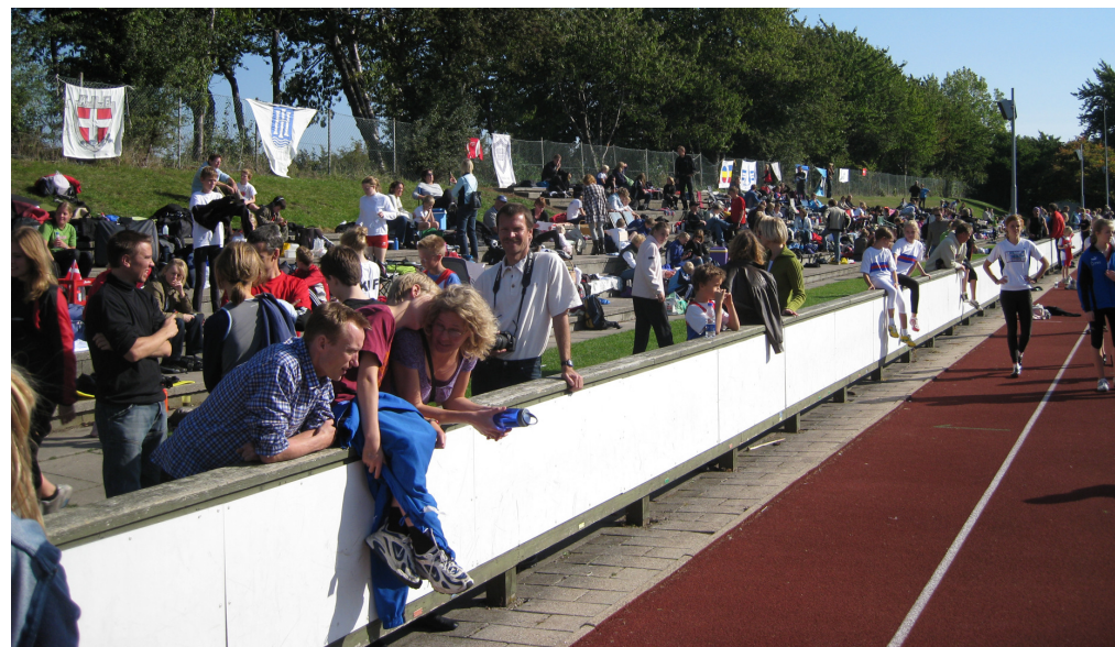
Billedet er fra Afslutningsstævnet 2008 d. 27. og 28. september.

Vi har afholdt stævnet med stor succes og megen ros igennem flere år og de seneste 5år har det været et af Danmarks største - sandsynligvis det største åbne ungdomsstævne, med udenlandsk deltagelse fra Sverige, Norge og Færøerne. I 2009 var der 567 tilmeldte deltagere fra 34 klubber og efter stævnet havde der været 2.057 starter. For at afvikle øvelserne mest effektivt, er der løb på begge langsider og 9 øvelsessteder (2x løb, 3x længdespring, højde, hold, disk og spyd) er i gang samtidig det meste af lørdagen. Med 241 deltagere afvikles 200meterne på knap 3½time og længdespring, som klart er favorit disciplinen, tog ca 16timer at afvikle med 318 deltagere.