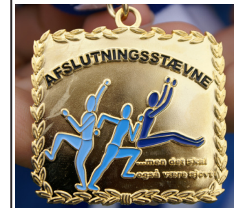
Den flotte Afslutningsstævne-medalje som Filippa Abild har designet - fik megen ros og skabte stor glæde blandt medaljetagererne.