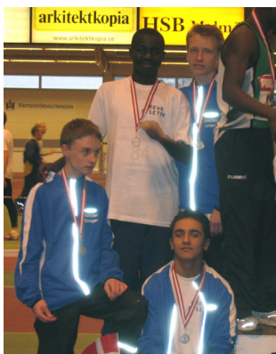
Vores 15årige stafet drenge blev nr 2 ved DM Inde på 4x200m i Malmö og satte med tiden 1.48,03 samtidig klubrekord med mere end 2½sekund.