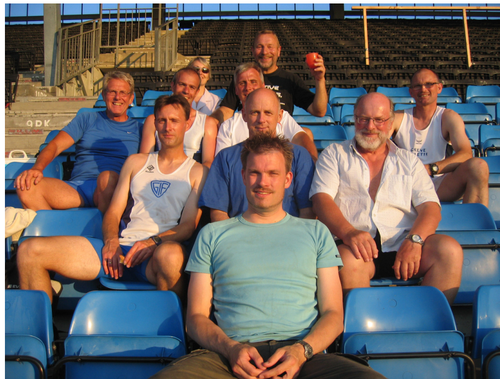
Veteranholdet efter 2. indledende runde i Hvidovre