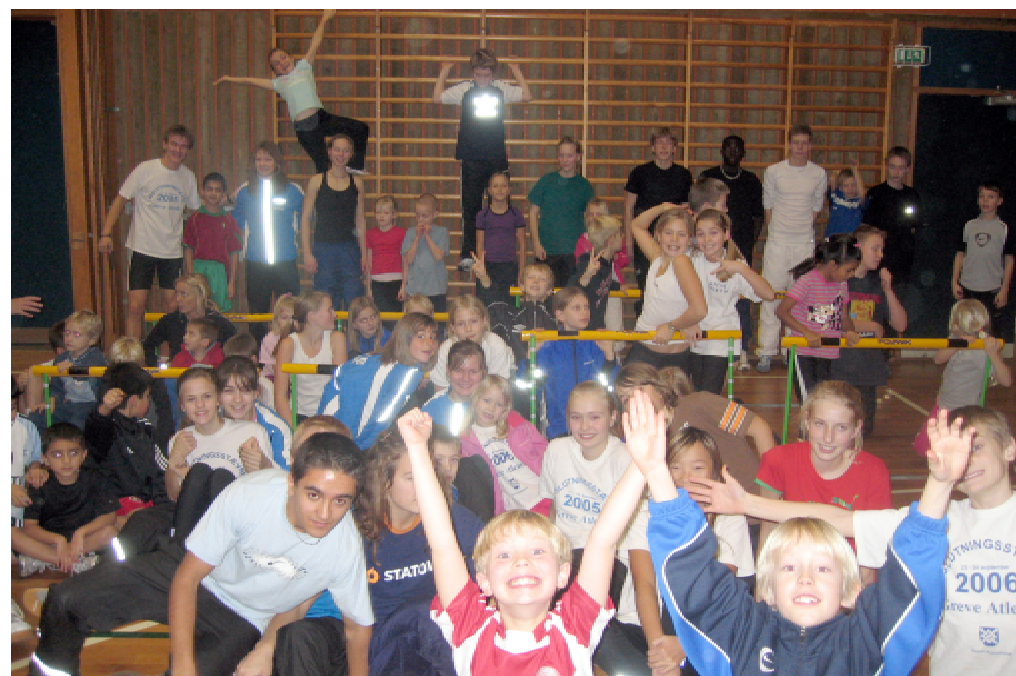
Billedet er fra ungdomsafdelingens juleafslutning (hvor er alle nissehuerne?). På billedet ses... mange af vores dygtige ungdommer, det bliver spændende at følge jer de næste mange år.