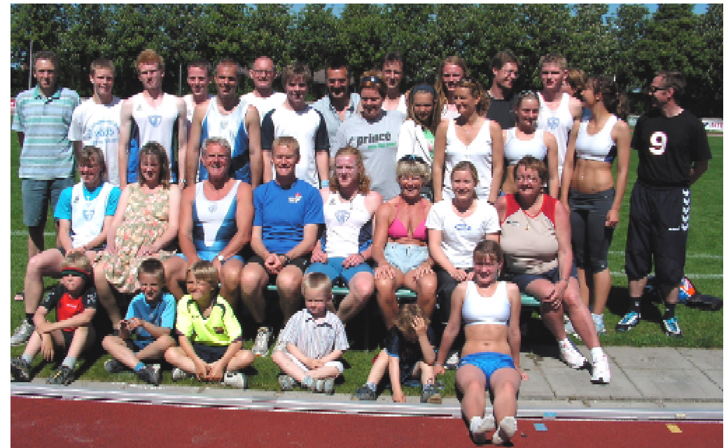
Billedet er fra DT matchen på Holbæk stadion d. 11. juni hvor både vores herre og dame hold var igang.