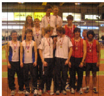
Til udendørs DM fik pigerne, med samme hold, desuden sølv på 1.000m stafet og bronze på 4x100m for 17årige.