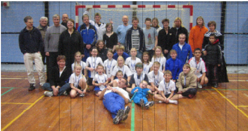
Gruppebillede af aktive, dommere og trænere fra Greve der var med til Sjøv med Atletik arrangementet vi holdt i marts 2005.